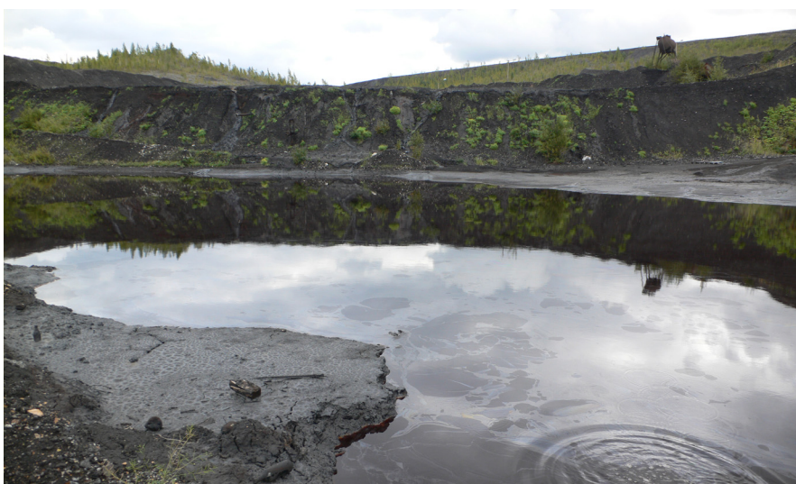
Joonis 1. Kohtla-Järve poolkoksimäel olev fuusijärv (september 2006)

Veekogude iga-aastase seire tulemused on kinnitanud, et Ida-Virumaal on pinna- ja põhjavesi fenoolidega reostunud. Aastakümnete vältel on suurimad fenoolikogused veekeskkonda juhitud Ida-Virumaa põlevkiviõlitööstusest. Kuni 2001. aasta lõpuni ladestati põlevkiviõli tootmisel tekkivaid vedeljäätmeid ehk fuuse Kohtla-Järve poolkoksimäkke. Sinna on neid kogunenud umbes 560 000 tonni, millest 460 000 on poolkoksi segamini poolkoksimäe sisemuses ja 100 000 tonni nn fuusijärves (joonis 1).